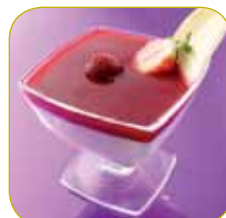
Fromage blanc et son coulis