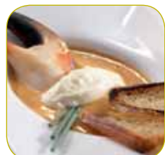
Soupe de poisson