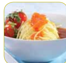
Coulis de tomates

Autres exemples : Bisques, gelée, base de sorbets, pulpes de fruits, coulis de légumes.