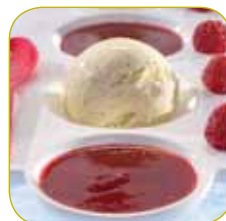
Ijs met vruchtensaus